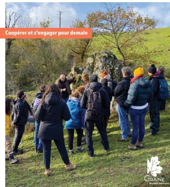
Coopérer et s'engager pour demain

E n accord avec les objectifs de sa Charte*, le Parc naturel régional de Massaches en France (le Parc), associé au Comité d'Architectes, d'Urbanisme et de l'Environnement (CAUE) de la Creuse, de la Creuse de la Haute-Vienne** s'est engagé pour la végétalisation des cours d'écoles inscrites de la méthode des cours "AGCQ" développée à Paris*. Avec le soutien de la direction de la base, une première rencontre est organisée pour présenter la méthode, l'adapter au site et aux caractéristiques de l'école. Cette première étape nécessite l'accord préalable de l'équipe enseignante et des élus pour s'engager dans une véritable démarche de projet en association avec les habitants. Les enseignants s'engagent une partie du dimanche dans des ateliers autour de leurs cantines, d'activités et de jeux. Les ateliers sont adaptés à la réalité du terrain et de la collectivité. Les temps de consultation pour aller avant au-delà de la consultation sont indispensables. S'ils ne sont pas la réalisation des travaux, ils auront contribué au projet en tant qu'acteurs expérimentés et auront défini pour leur successeur.