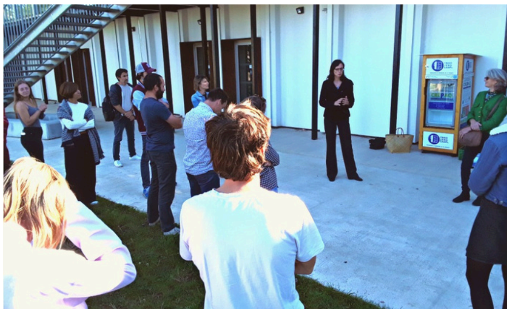
Inauguration du Frigo Zéro Gasp® à Bordeaux Sciences Agro

" Tout seul on va plus vite, Ensemble on va plus loin ! "