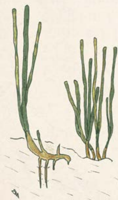
Zostera noltei

Petite oie sibérienne qui vient hiverner dans les Pertuis charentais où elle se nourrit sur les herbiers de zostère naine. La surface d'herbier de la réserve naturelle représente 10 % de la surface totale des herbiers de l'Hexagone.