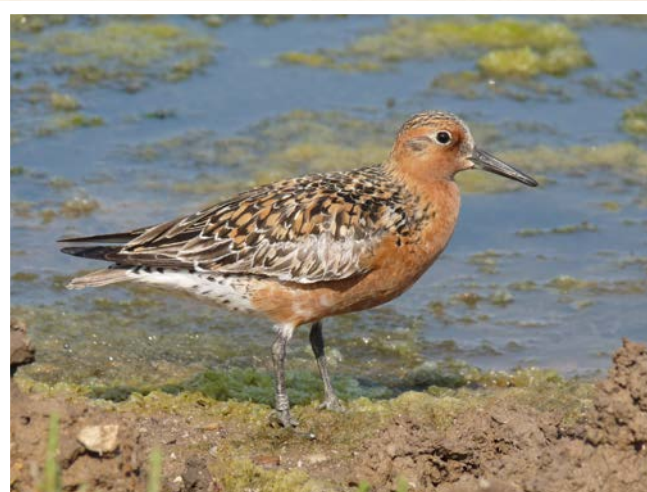
Bécasseau maubèche