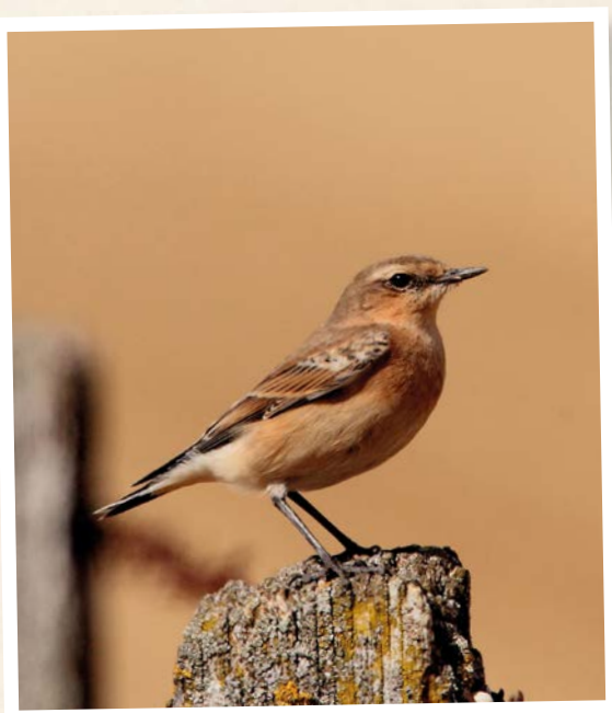
Traquet motteux

Migration is incredibly exhausting: birds breed beyond the Arctic Circle and winter in sub-Saharan Africa while stopping only in a few places to refuel. For example, the wheatear (less than 25 grams) travels 30,000 kilometers per year!