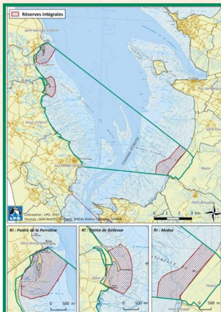
Limite de la réserve naturelle de Moëze-Oléron et les 3 secteurs en réserves intégrales (secteur interdit au public)

When entering the Reserve, let's listen, look and enjoy the show and the magic of nature. Let's have fun on the beaches and paths while protecting our environment.