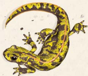
Triton marbré

In the past, salt extraction and oyster farming were the main activities. Today, hydraulic management (fresh and salt water on the polderised marches) and grassland management (bovine and sheep grazing) determine the halting of migratory birds in the nature reserve. Global warming and rising sea levels will shape the evolution of this coastline and the human activities.