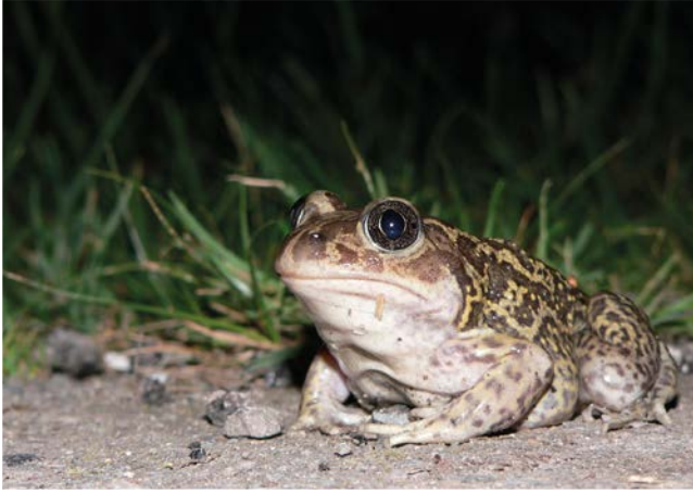
Pélobate cultripède