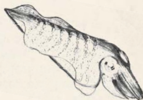
Sepia officinalis © N. Bourret

Arrêté municipal n°09/2015 du 15 juin 2015 portant sur la réglementation du site naturel protégé de Plaisance