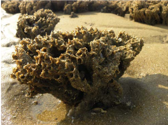
Récifs d'hermelles