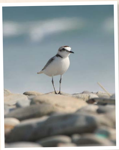
Gravelot à collier interrompu © R. Bussi re-LPO

The Kentish plover breeds in the drift line. Its presence is an indicator of good quality of the beaches. Terns often rest at Pointe de la Perrotine on the sandbanks during the post-nuptial migration.