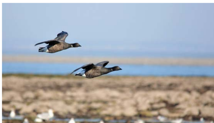
Bernaches cravants