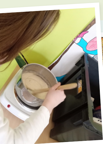
Pâte à modeler DIY* Cadillac