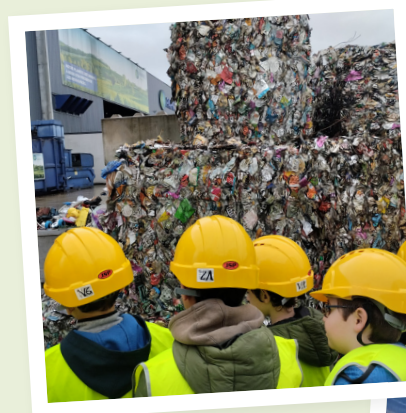
Visite du centre de tri - CN Montesquieu (depuis 2018)

Modalités : découverte courte ou projet sur l'année scolaire