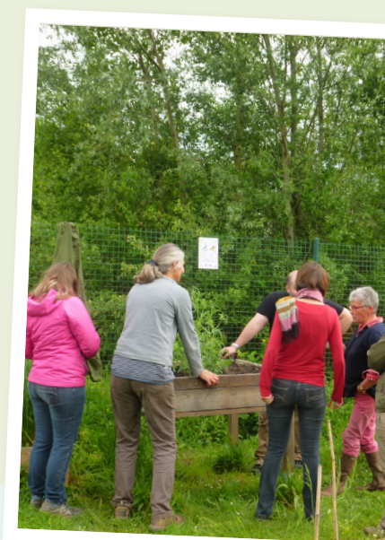
Sensibilisation jardinage au naturel avec le Sictom (depuis 2017)