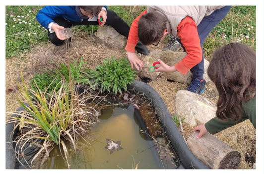
Observation de la faune de la mare - CN CC de Montesquieu (depuis 2018)