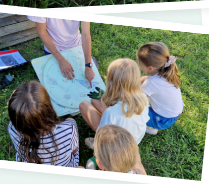
La roue des semis, support pédagogique