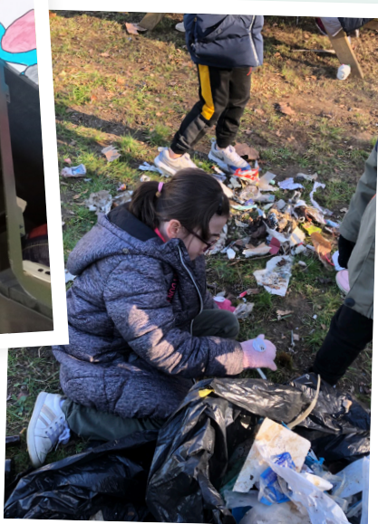
Marche verte - CN La Réole (depuis 2014)