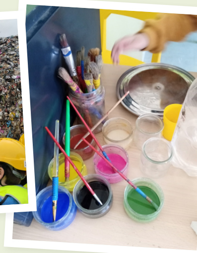
Fabrication de peinture - CN Cadillac (depuis 2021)