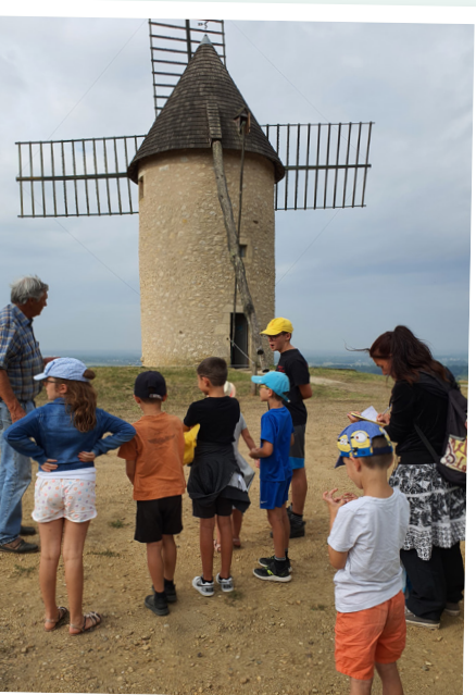
Visite du moulin de Cussol - CN Savignac (depuis 2014)