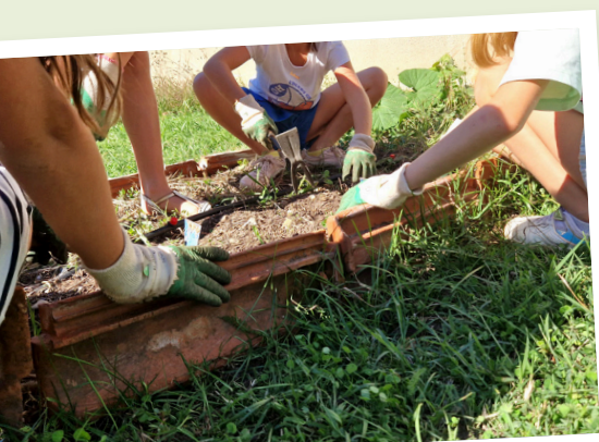
Entretien d'un potager - CN Barsac (depuis 2015)