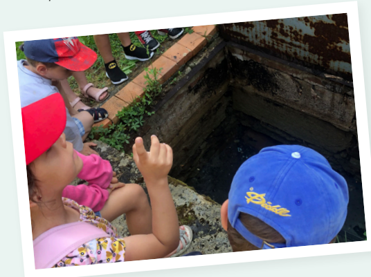
Observation d'une résurgence - CN AVL (depuis 2015)