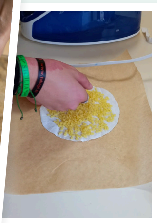
Fabrication de produits ménagers et de bee-wraps - Lycée de Cudos (2022)