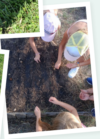
Semis à l'école de Cérons (depuis 2015)