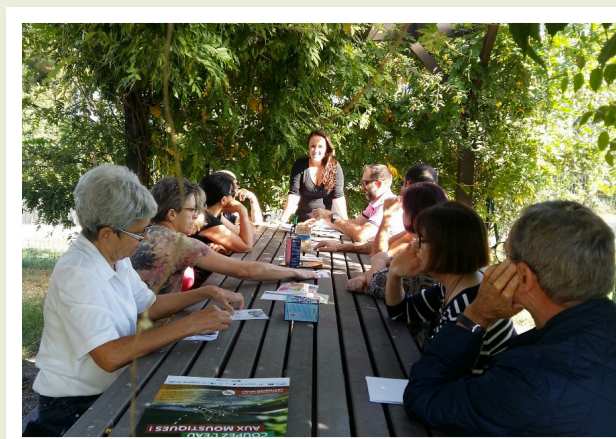
Sensibilisation au moustique tigre (depuis 2018)