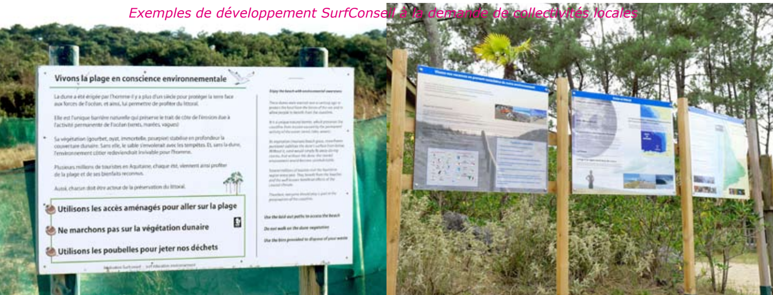
Réalisation d'un panneau de sensibilisation à la dune littorale.

Exemples de développement SurfConseil à la demande de collectivités locales